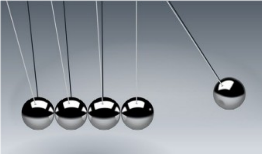
Abbildung 1. Kugelstoßpendel [7]

Im vorliegenden Green Paper ist eine skalierbare global einsetzbare Mit Virus leben (#MiViLe-Lösung) für die Überwachung und Eindämmung des epidemiologischen Geschehens beschrieben. Die Kernbestandteile der #MiViLe-Lösung: 1) Erfassung von Massenveranstaltungen in einer Matrix ( bspw. eine Datenbank, die ähnlich dem Domain Name System (DNS) der DENIC eG aufgebaut ist) 2) Integration von Verfahren, die im Microsoft Patent WO2020060606 und in der Corona-Warn-App beschrieben sind.